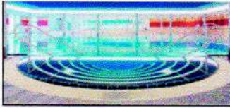
Piscinas y espejos de agua

Impermeabilización y restauración de obras • Instalación de cerámicas y piedra natural • Tecnología del concreto • Reparación del concreto • Pisos industriales • Lechadas, anclajes y adhesivos