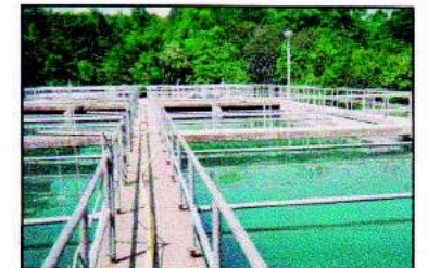
Plantas de tratamiento de aguas