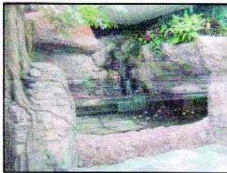
Tanques, acuarios y fuentes