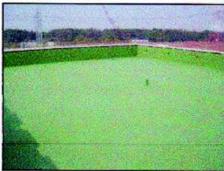
Balcones, terrazas y azoteas