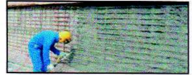
Estructuras de concreto