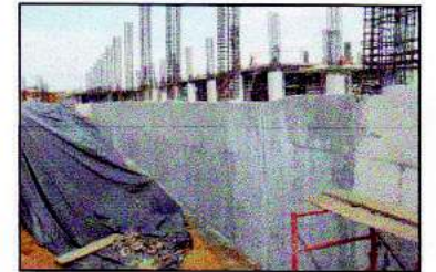
Paredes y muros de contención